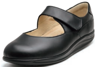
014099 ブラック 2-6½ ㊞