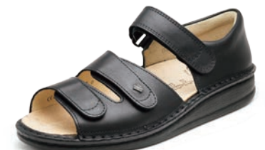
001099 ブラック 35-43 A