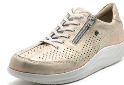
769481 SS シャンパン 2-7½ ⑧