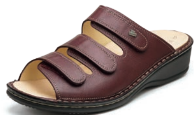
120114 ボルドー 34-40 A