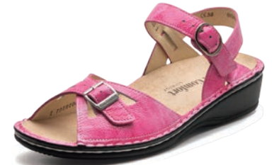
022178 SS ピンクエナメル 34-39 A