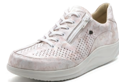
764487 SS ピンクプリント 2-7 ⑧