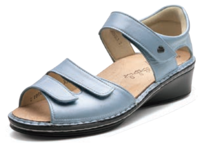
050214 SS スカイパール 2-6½ ㊸