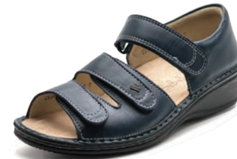
604041 SS ネイビー 34-41 A