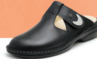
014099 ブラック 34-40 A