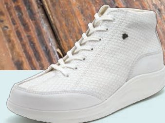
902413 SS ホワイト/ホワイトメッシュ 2½-7 ㊞