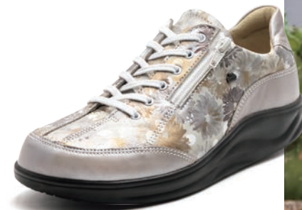
902608 SS ページュパール/シルバープリント 2-6½ ㊞