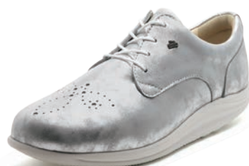
577095 SS シルバー 2½-6½ ㊞