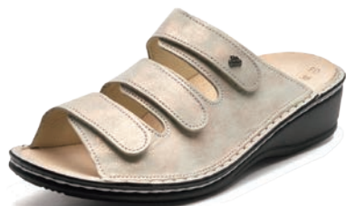
769481 SS シャンパン 34-39 A