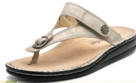
769481 SS シャンパン 34-39 A