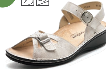
022140 SS アイボリーエナメル 34-39 A