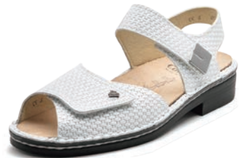
224000 SS ホワイトメッシュ 2-5½ ㊸