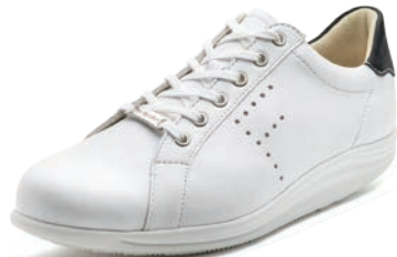
902611 SS ホワイト/ブラックヌバック 2-7 ㊞