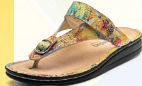
762010 SS アートマルチ 34-39 A