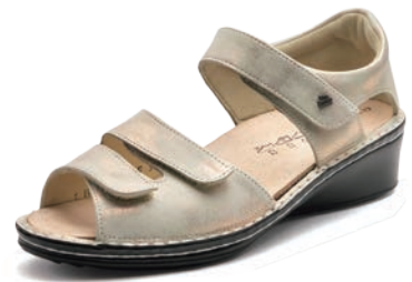
769481 SS シャンパン 2-6½ ㊸