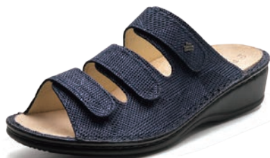
761319 SS ネイビーメッシュ 34-39 A