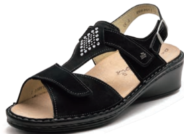
007099 SS ブラックヌバック 2-5½ ㊸