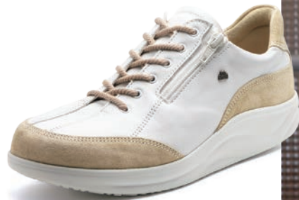
902576 SS アイボリーベロア/ホワイト 2-8½ ㊞