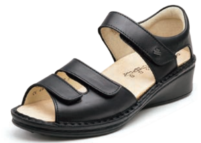
014099 ブラック 2-6½ ㊸