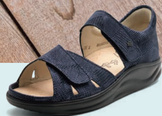
761319 SS ネイビーメッシュ 2-6½ ⑥