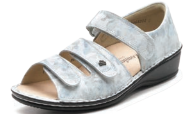
764485 SS ブループリント 34-40 A