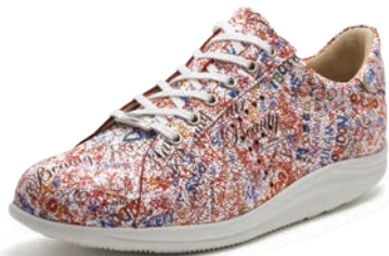
732103 SS ワーズレッド 2½-6½ ㊞