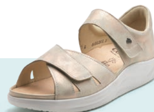
769481 SS シャンパン 2-6½ ⑥