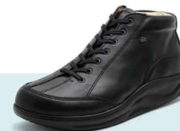
001099 ブラック 2-7 ㊞