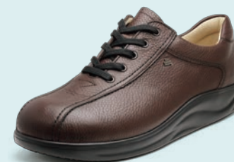
131145 ダークブラウン 6-9 ㊞