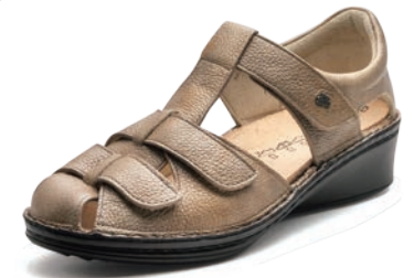
705081 SS アルファートゥーブ 2-6½ ㊸