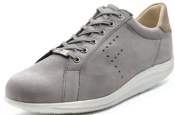
902610 SS グレイヌバック/ダークベージュヌバック 2-6½ ㊞