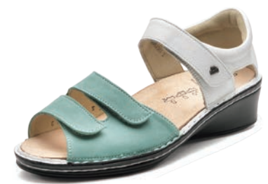
902605 SS アイスグリーンヌバック/ホワイト 2-6 ㊸