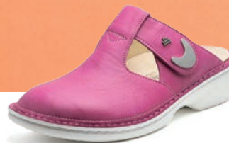
604178 SS ピンク 34-40 A