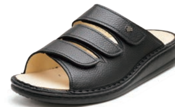
055099 ブラック 35-43 A