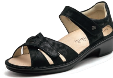
644144 SS ブラックプリント 2-6½ ㊸