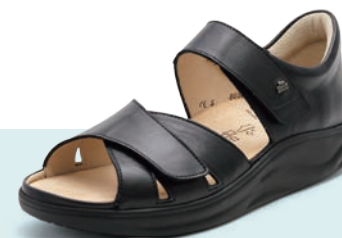
014099 SS ブラック 2-7 ⑥