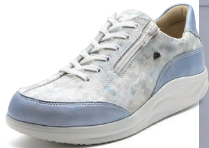
902607 SS スカイパール/ブループリント 2-6½ ㊞