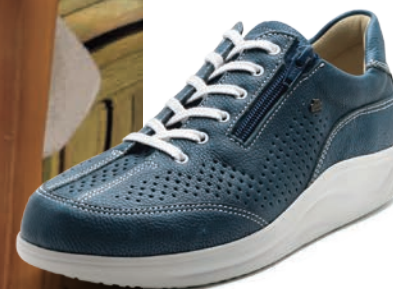
766241 SS ブルー 2-9 ⑧