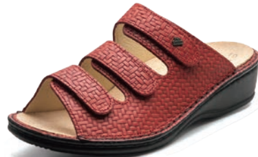
771420 SS レッドメッシュ 34-39 A