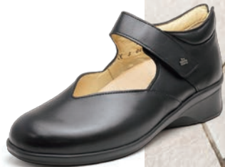
014099 ブラック 2-6½ ㊸