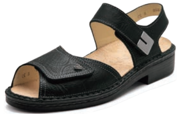
760099 SS ブラックエンボス 2-5½ ㊸