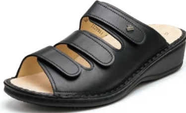
001099 ブラック 34-40 A