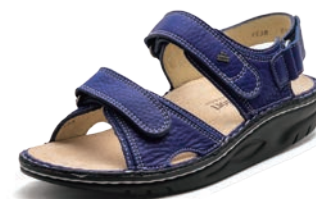
650440 SS コバルト 35-40 ④