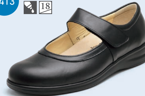
014099 ブラック 2-6½ ㊸