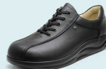
131099 ブラック 6-9½ ㊞