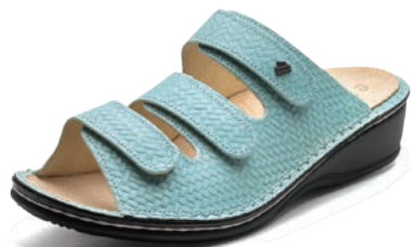
771480 SS チェレステメッシュ 34-39 A