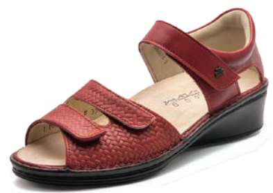
902633 SS レッドメッシュ/レッド 2-6 ㊸