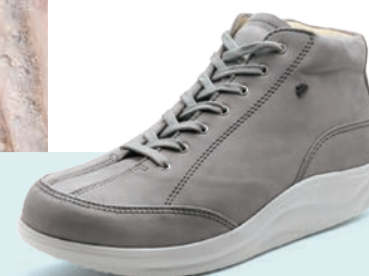
007429 SS グレイヌバック 2½-6½ ㊞