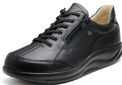
001099 ブラック 2-9 ㊞