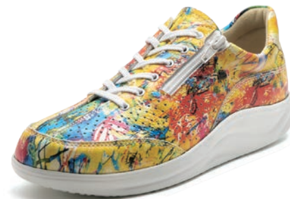
762010 SS アートマルチ 2-7 ⑧