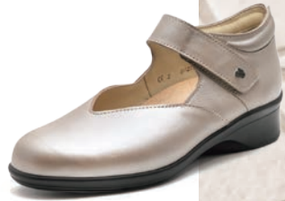
385081 SS ベージュパール 2-6 ㊸