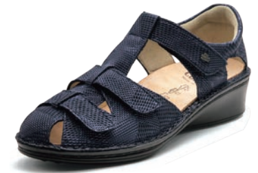
761319 SS ネイビーメッシュ 2-6½ ㊸