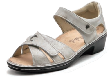
022140 SS アイボリーエナメル 2-6 ㊸