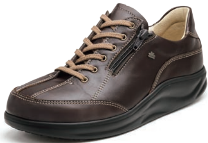
239023 カフェ 2-9 ㊞