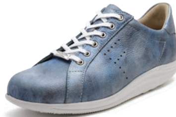
705124 SS アルファジーンズ 2-7 ㊞