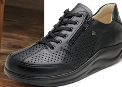
001099 ブラック 2-9 ⑧