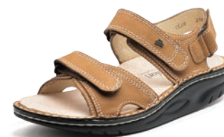
007457 SS ブラウンヌバック 35-40 ④