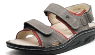
901211 SS グレイヌバック/レッドヌバック 35-40 ④