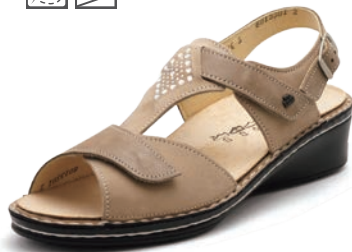
902450 SS ベージュヌバック/ベージュ 2-5½ ㊸